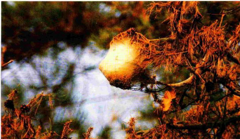
Nido di Thaumetopoea pityocampa.

In entrambi i casi lo scopo sarà quello di realizzare un ambiente sfavorevole ed inidoneo alla vita della processionaria durante il suo ciclo di sviluppo.