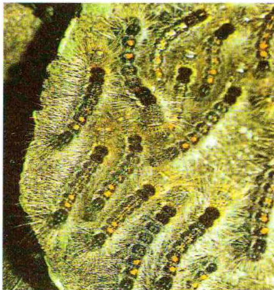
Giovani larve di E. Chrysorrhoea

Danni: le larve nascono e divengono attive nel pieno dell'estate, dalla fine di luglio alla metà di agosto. Hanno colore bruno nerastro, sono dotate di setole biancobruno (dalle proprietà urticanti) e sul dorso sono provviste di tubercoli color arancio. Ai lati del corpo si notano delle striature longitudinali bianco - arancio. Le larve manifestano tendenze gregarie. Le foglie delle piante ospiti (quercia, tiglio, acero, pioppo, carpino, rosacee e fruttifere varie) vengono ridotte alla sola nervatura. L'attacco determina dunque diffuse defogliazioni delle specie vegetali attaccate, che subiscono indebolimento e predisposizione ad altre malattie. Le modalità di lotta sono analoghe a quelle per Hyphantria Cunea .