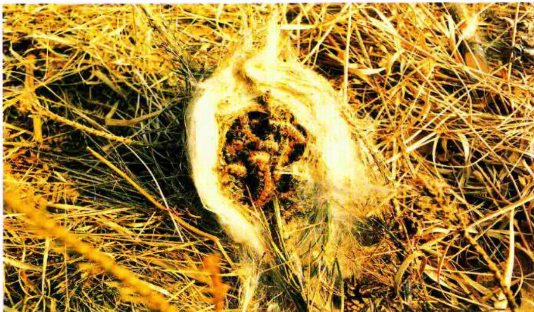
Nido aperto colmo di larve di processionaria del pino.

La processionaria è un insetto appartenente all'ordine dei Lepidotteri, le comuni farfalle. Durante gli stadi larvali (bruchi) le processionarie sono fitofaghe; si alimentano cioè delle parti verdi delle piante, provocando defogliazioni, indebolimento e blocco dell'accrescimento. Il riconosciuto potere molesto delle larve è dovuto alla presenza su di esse di numerosissimi peli urticanti che possono causare irritazioni e allergie cutanee all'uomo. Le popolazioni di processionaria sono soggette ad ampie fluttazioni cicliche, per cui si succedono periodi con sporadiche e modeste apparizioni a periodi con massicce infestazioni. Ciò avviene ogni 8 - 10 anni. Ci sono due specie di processionaria nella nostra penisola: la processionaria del pino ( Thaumetopoea pityocampa ) e la processionaria della quercia ( Thaumetopoea processionea ). Queste hanno un ciclo biologico diverso e in conseguenza di ciò i trattamenti, che devono essere effettuati sulle larve giovani, cadono per la processionaria del pino in agosto - settembre e per la processionaria della quercia in marzo - aprile.