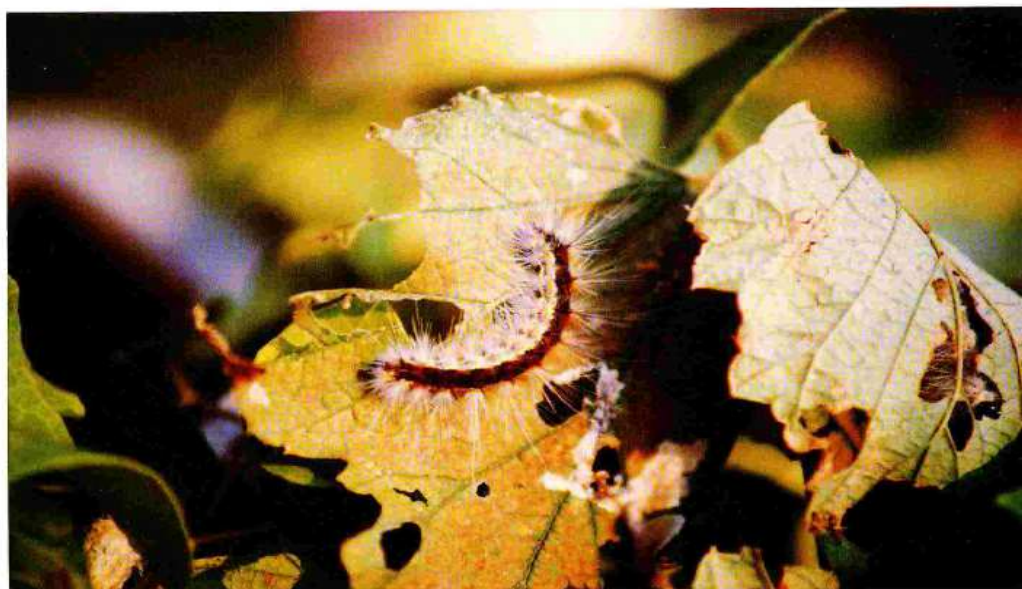
Larva di Hyphantria Cunea

Al centro - sud o nelle isole, si potrebbe anche giungere a tre generazioni l'anno.