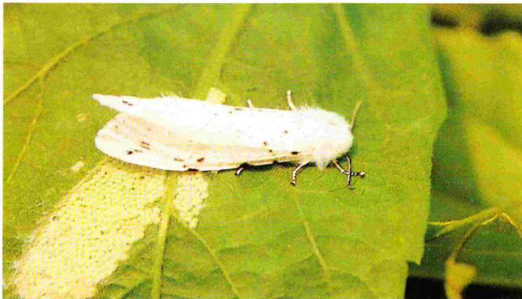
Adulto femmina di Hyphantria C. durante l'ovodeposizione.

I bruchi, raggiunta la maturità (in un mese circa) si mettono alla ricerca di adatti ricoveri: nel terreno, in un anfratto di tronco d'albero, in crepe nei muri, sotto le tegole delle abitazioni, per incrisalidarsi e svernare (larve della II generazione).