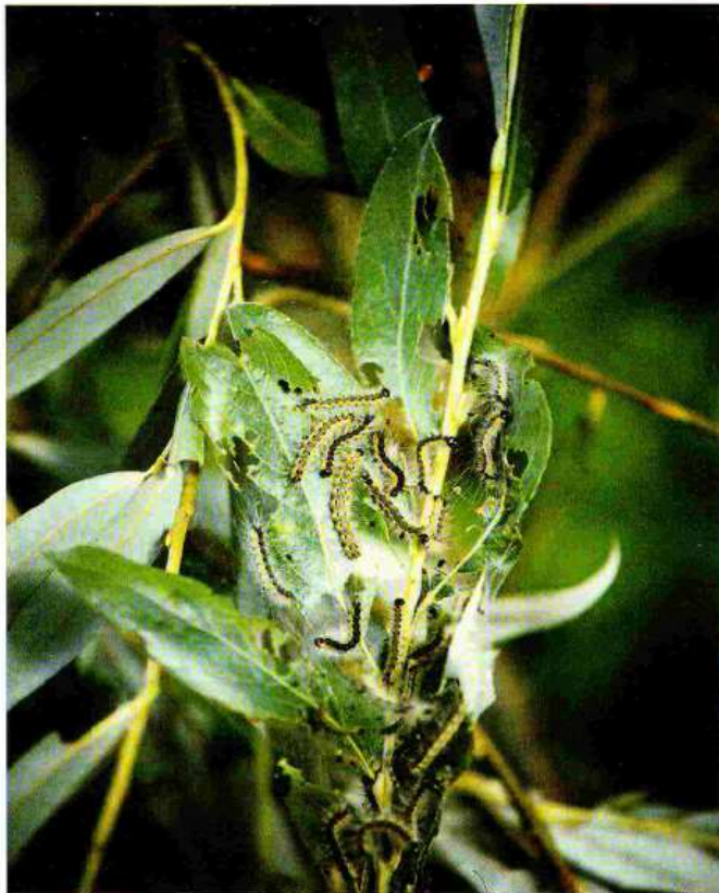
Larve di Hyphantria Cunea

le larve, estremamente polifaghe, provocano defogliazioni a carico di numerose specie, prediligono il gelso e l'acero negundo (che sono i primi ad essere attaccati). Noce, pioppo, platano, salice, tiglio, sambuco sono frequentemente colpiti e, nel caso di gravi infestazioni, anche ippocastano ed olmo, diverse specie di frutteti e di arbusti ornamentali possono essere danneggiati. Danni occasionali e solitamente contenuti si possono inoltre verificare sul finire dell'estate, a carico di coltivi di erba medica, mais e soia, attigui ad alberate intensamente defogliate.